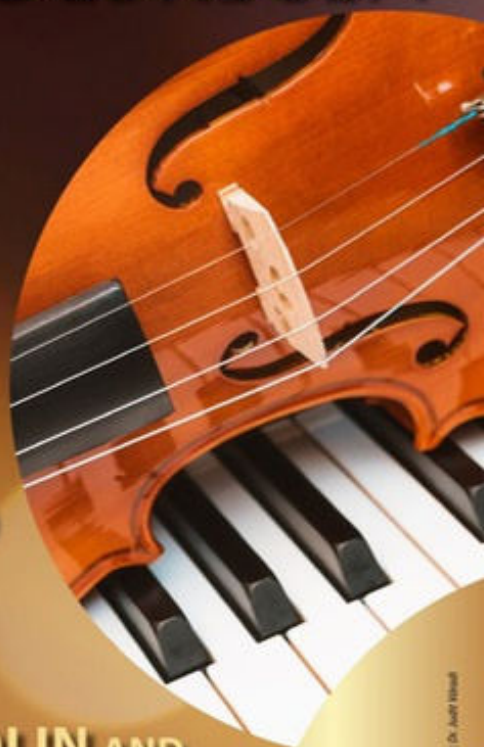
We reserve the right to modify programs. | Credits: Editor: Dr. Anett Hossai

Admission is free for conference participants with the name badge.